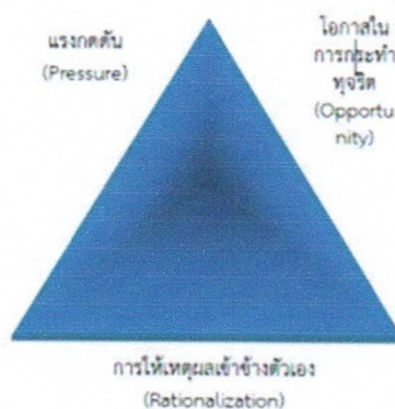
ภาพ การพัฒนาของทฤษฎีสามเหลี่ยมการทุจริต